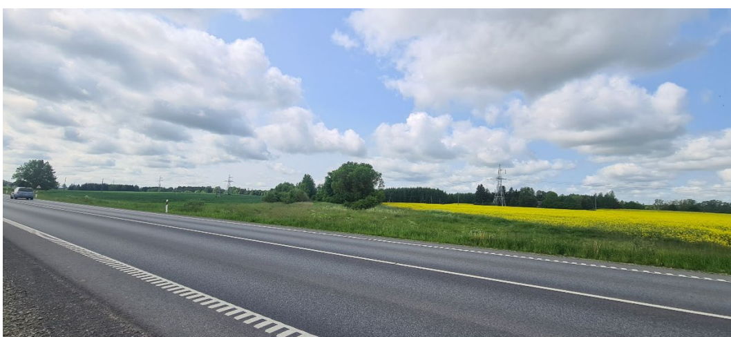
6. Papyvesių kaime magistralę kertantis siaurojo geležinkelio komplekso (21898) Panevėžio – Biržų ruožas iš šiaurės rytų.