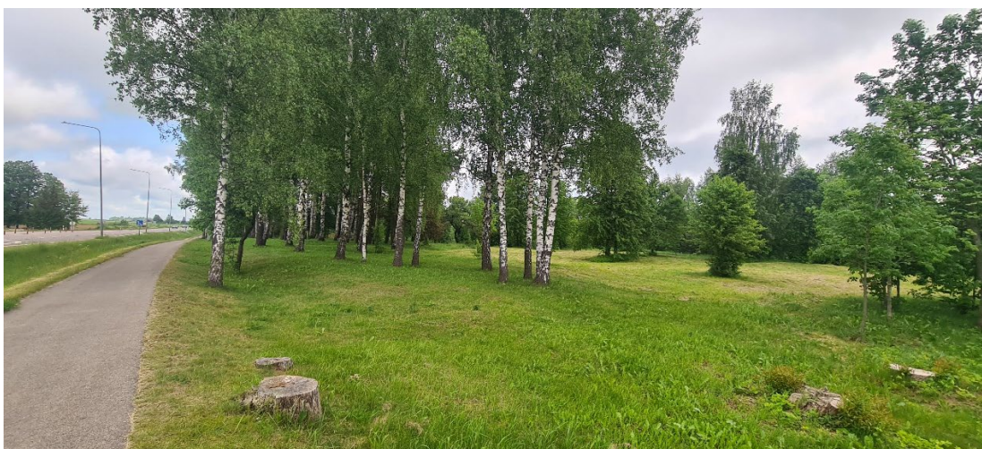
3. Pumpėnų žydų kapinės (20731) iš pietų.