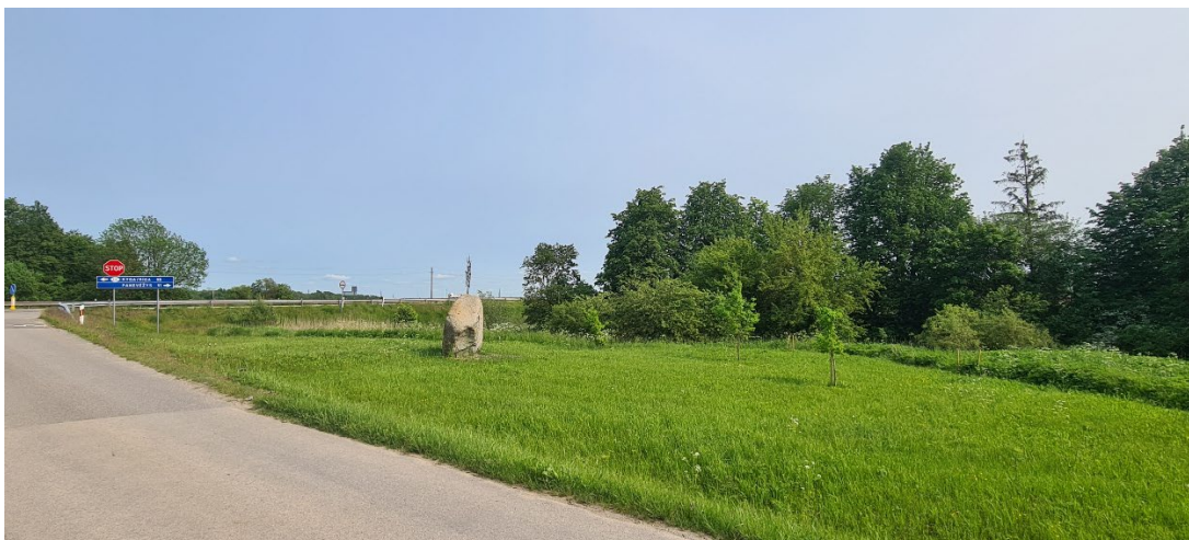
2. Akmenės ženklas - akmuo Raudonpamūšės kaime iš šiaurės vakarų.