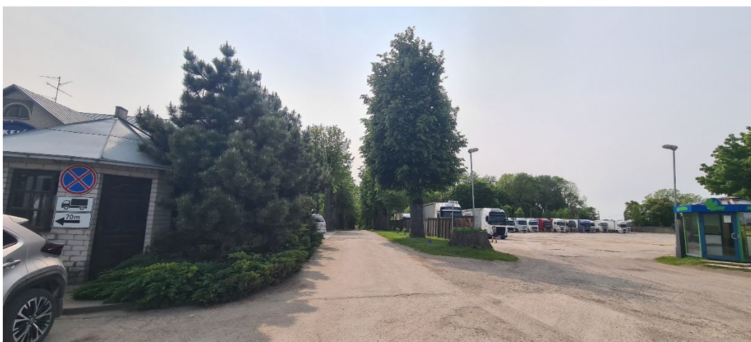
5. Škilinпамūšės dvaro (436) alėjos dalis iš rytų.