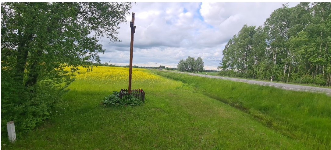
1. Šiaulių ženklas I (33322) - kryžius Stanionių kaime iš pietų.