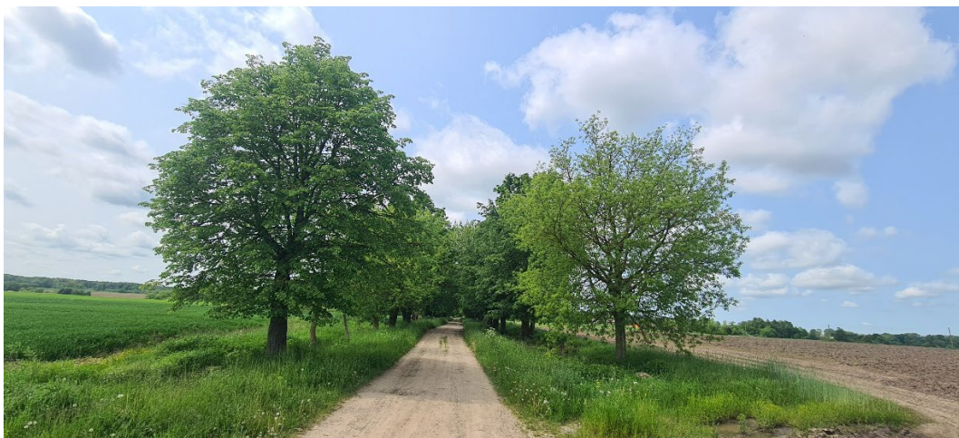
4. Raudonpamūšės dvaro (433) alėjos dalis iš rytų.