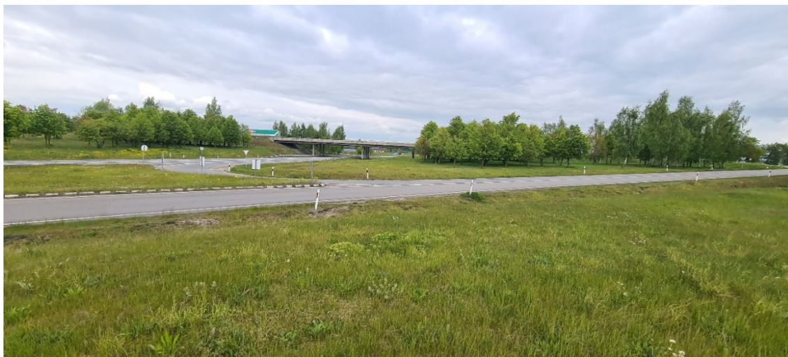
3 pav. Nociūnų kapinyno vaizdas iš pietryčių 2025 m. vasarą.