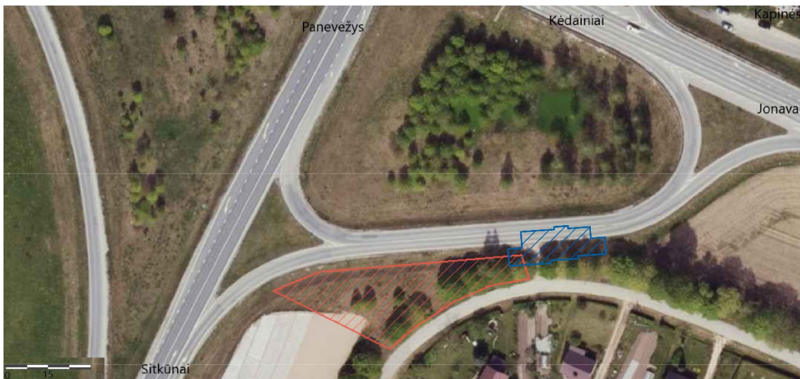
1 pav. Nociūnų kapinyno (26636) situacijos planas su pažymėta saugoma teritorija (užbrūkšniuota raudonai) ir 1999 m. tyrinėta (užbrūkšniuota mėlynai) teritorijomis. M. Zabielaitytės brėž.