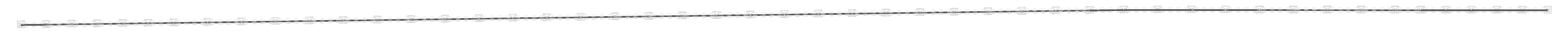
Triukšmą slopinančių sienelių planas. M 1 : 200