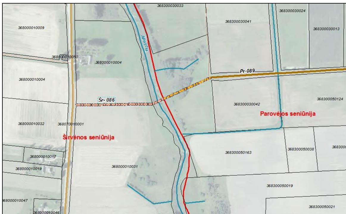
1 pav. Numatoma kelio Nr. Pr-089 rekonstrukcija

Po rekonstrukcijos kelio Pr-089 ilgis būtų 0,65 km. Rekonstruojamo kelio daliai, patenkančiai į Širvėnos seniūniją, suteikiamas numeris Nr. Šr-086. Viso rekonstruojamo kelio plotis pagal kelio kategoriją turi būti ne mažesnis kaip 10 m. Rekonstruojant 0,40 km kelio ruožą bus reikalinga naujo tilto statyba per Apaščios upę ir nuovaža nuo valstybinės reikšmės krašto kelio Nr. 190. 1 paveiksle parodyta planuojamos kelio atkarpos vieta.